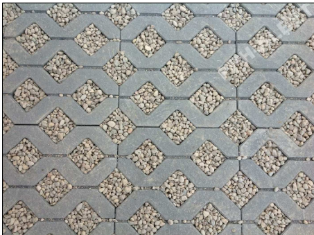
płyty betonowe ażurowe, szare typu Meba

betonowe płyty ażurowe typu Meba, gr. 10cm podsypka z kruszywa łamanego 0,075/4mm, gr. 5cm podbudowa zasadnicza z kruszywa łamanego 0/31,5mm stabilizowanego mechanicznie gr. 20cm podbudowa pomocnicza z kruszywa naturalnego 0/63mm stabilizowanego mechanicznie gr. 30cm