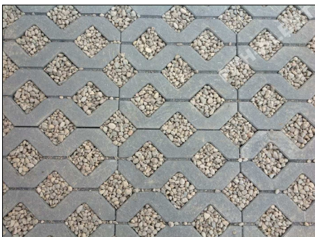
płyty betonowe ażurowe, szare typu Meba

betonowe płyty ażurowe typu Meba, gr. 10cm podsypka z kruszywa łamanego 0,075/4mm, gr. 5cm podbudowa zasadnicza z kruszywa łamanego 0/31,5mm stabilizowanego mechanicznie gr. 20cm podbudowa pomocnicza z kruszywa naturalnego 0/6,3mm stabilizowanego mechanicznie gr. 30cm