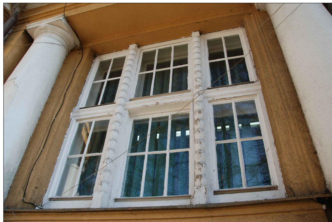
dokumentacja fotograficzna stolarki O10